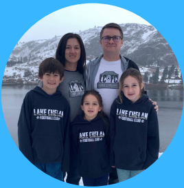
MR. BROOME HS COUNSELOR GRADES 9-12